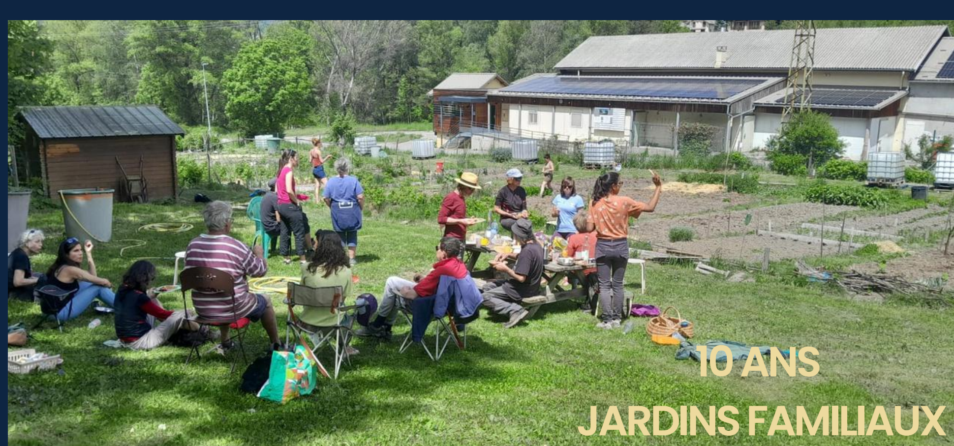
10 ANS JARDINS FAMILIAUX