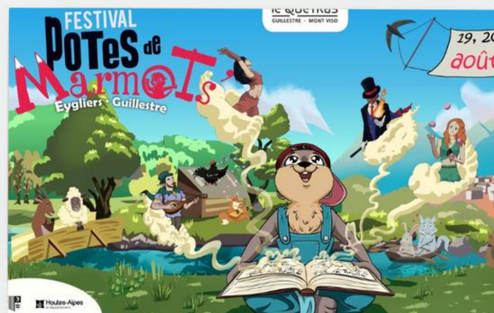
POTES DE MARMOTS