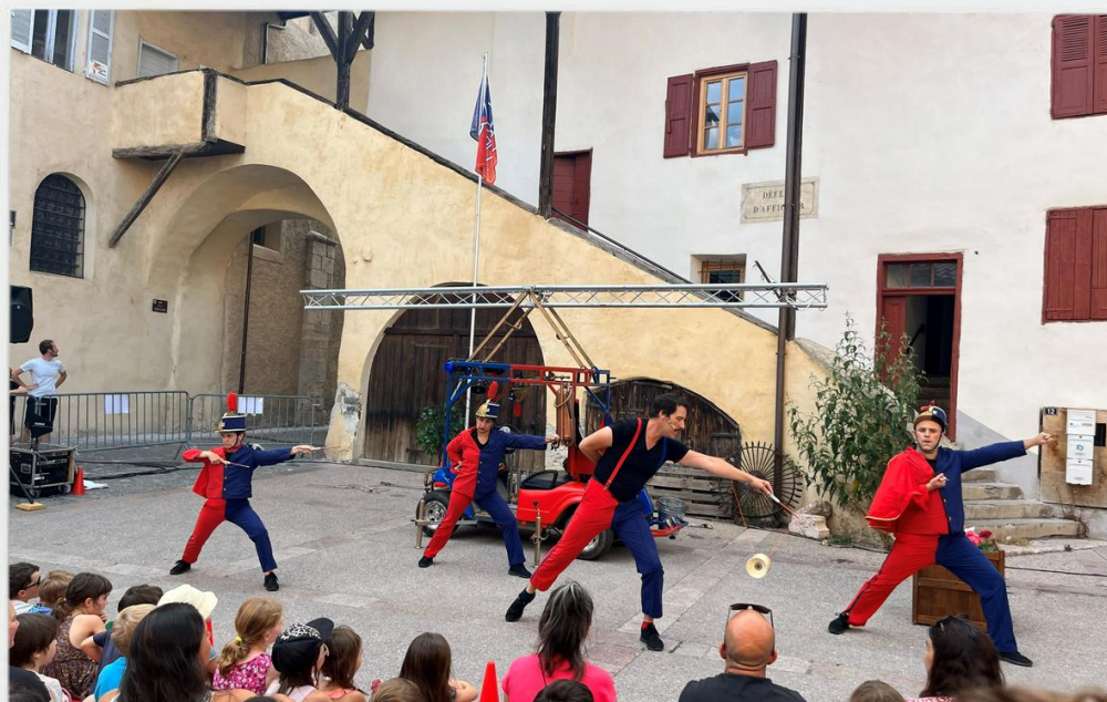
FESTIVAL DE THÉÂTRE