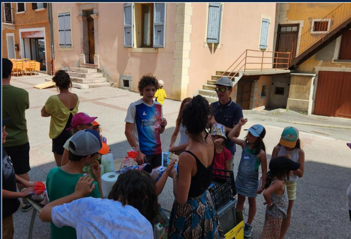
CONCOURS DE KAPLAS