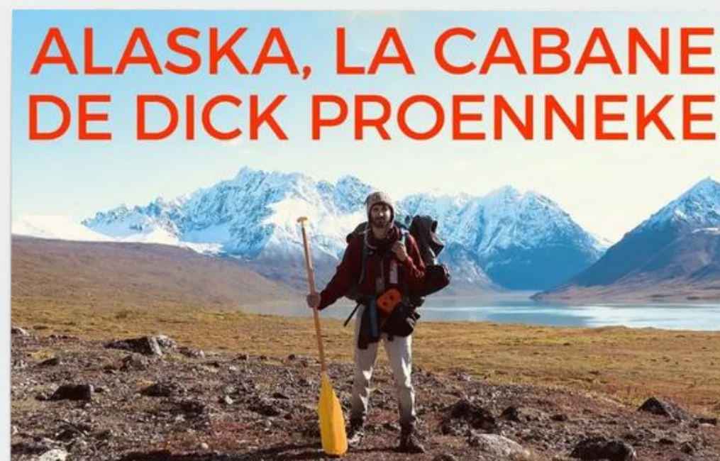
CINÉMA EN PLEIN AIR