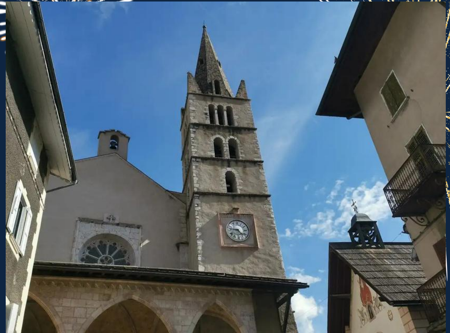
Guillestre 57ème ville de rêve