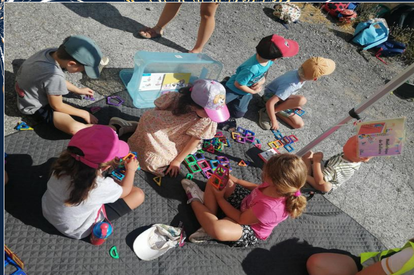
CENTRE DE LOISIRS