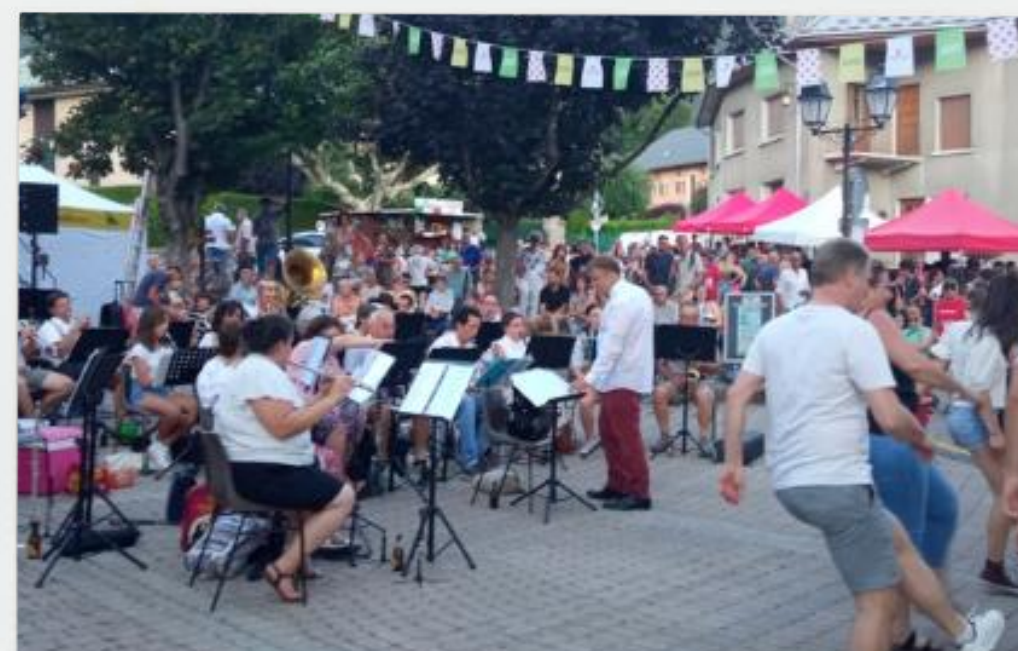
FÊTE DE LA BIÈRE