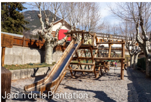
Jardin de la Plantation

Skate park près de la crèche, composé de plusieurs rampes et de modules. Il est en accès libre.