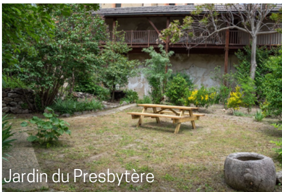
Jardin du Presbytère

Le dernier, le plus vaste, est l'ancien jardin du Presbytère qui a été ouvert au public sur décision conjointe avec le diocèse et la mairie.