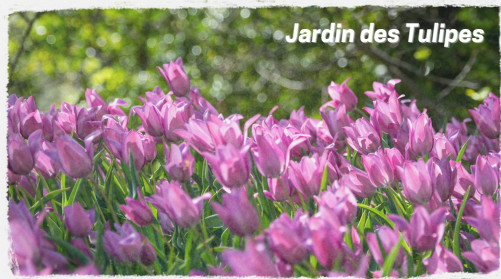
Jardin des Tulipes